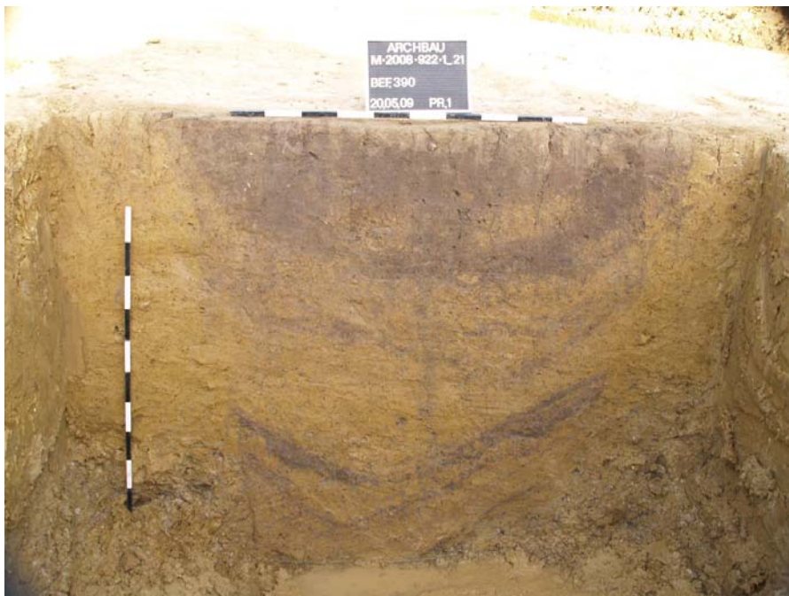
Fläche 21. Brunnen mit den Verfüllschichten.

Bei zwei Befunden kann es sich um mit Holz oder Flechtwerk ausgekleidete Brunnen gehandelt haben, deren hölzerne Auskleidung jedoch vergangen ist; der tiefere von beiden war noch 1,24 m tief erhalten. In heutiger Zeit steht in dieser Tiefe bereits das Schichtwasser an. Die genaue Datierung der Befunde war aufgrund fehlender Funde leider nicht möglich.