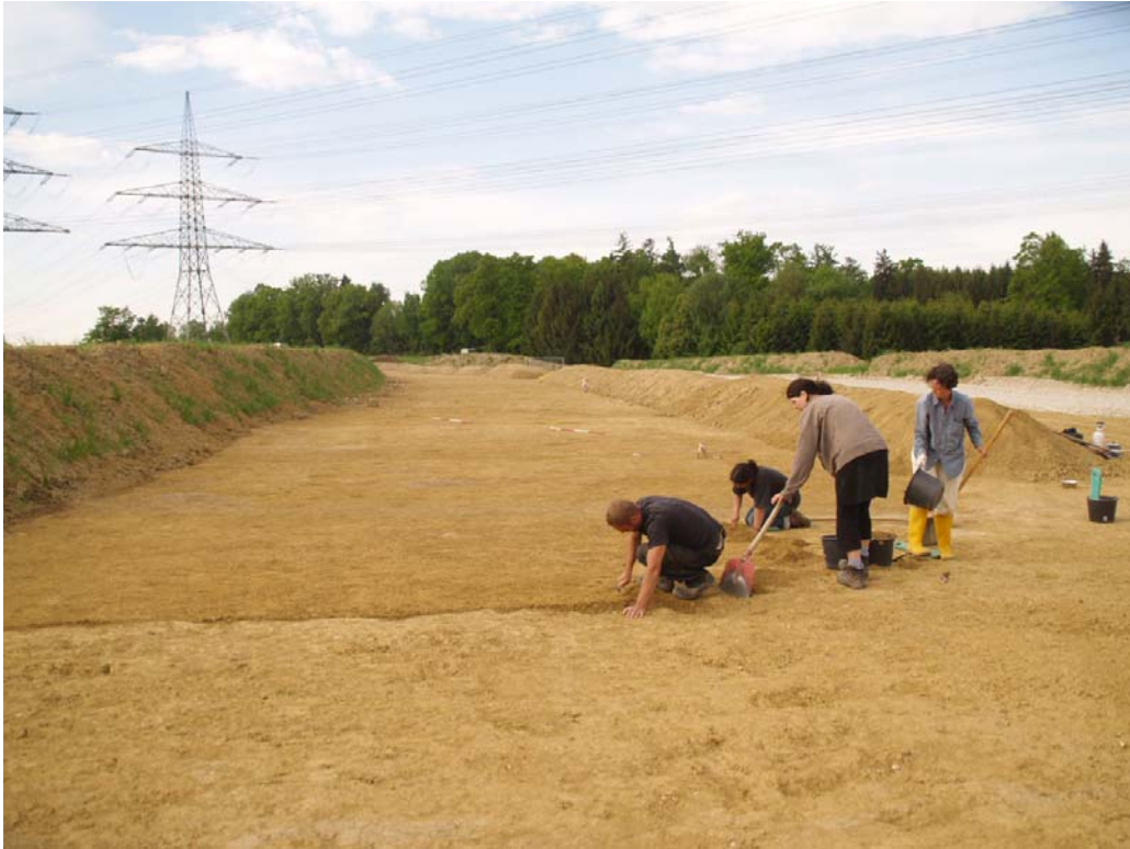
Anlegen eines Feinplanums vor der Dokumentation des Planums

Am 10. November 2008 begannen die archäologischen Arbeiten an der FTO V mit der Anlage des ersten Feinplanums in Fläche 1, am 22. Juni 2009 endeten sie mit der Entnahme der letzten Befunde auf Fläche 21. Insgesamt wurden auf 3,5 km Länge 26 Flächen bearbeitet.